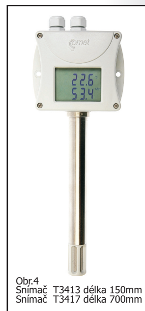
Obr.4 Snímač T3413 délka 150mm Snímač T3417 délka 700mm