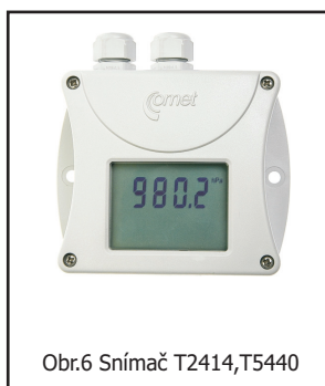
Obr.6 Snímač T2414, T5440