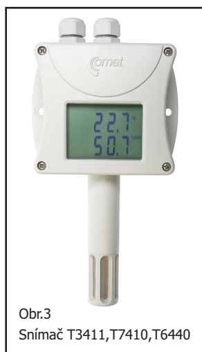
Obr.3 Snímač T3411, T7410, T6440