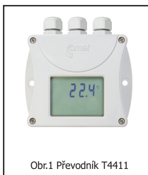
Obr.1 Převodník T4411

1) Maximální teplota platí pouze pro měřicí konec s čidly. Při teplotách nad +85°C nesmí relativní vlhkost v trvalém provozu překročit povolenou mez dle grafu dále v katalogu. V okolí plastové hlavice je maximální povolená teplota +80°C.