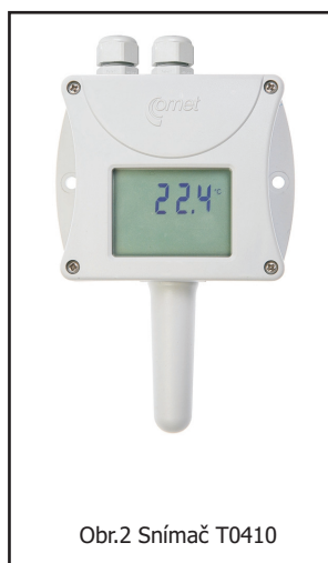
Obr.2 Snímač T0410