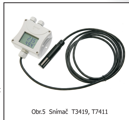
Obr.5 Snímač T3419, T7411

Další příslušenství - viz dále v katalogu