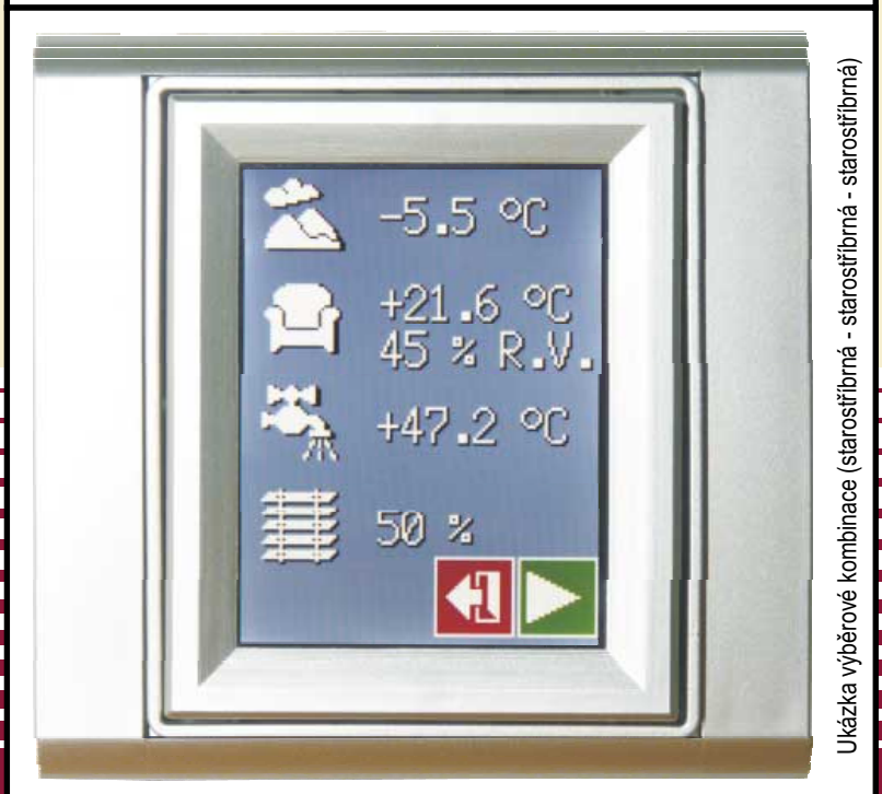
Ukázka výběrové kombinace (starostřibrná - starostřibrná - starostřibrná)

MICROPEL s.r.o. Krymská 12, 101 00 PRAHA 10