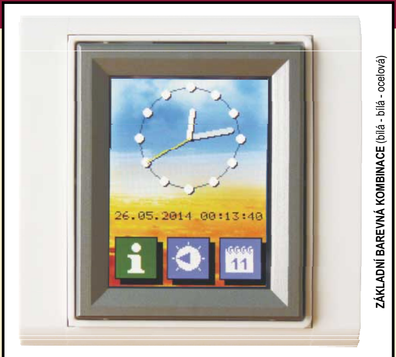
ZÁKLADNÍ BAREVNÁ KOMBINACE (bílá - bílá - ocelová)

MT424 může obsahovat připojené čidlo teploty (provedení T) nebo teploty/vlhkosti (provedení H). V těchto případech je čidlo vestavěno v dodaném rámečku, připojuje se do příslušného konektoru.