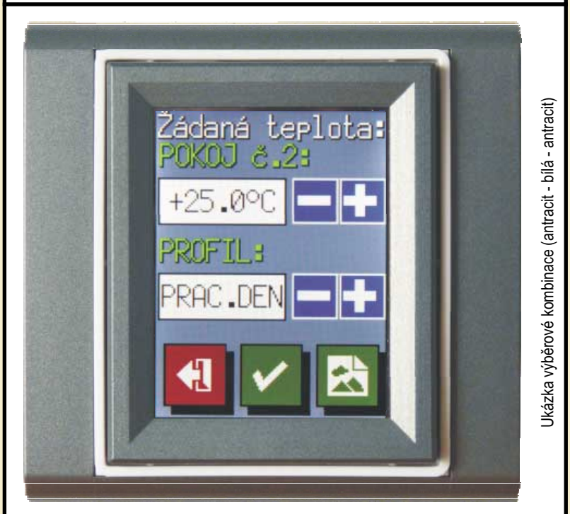
Ukázka výběrové kombinace (antracit - bílá - antracit)